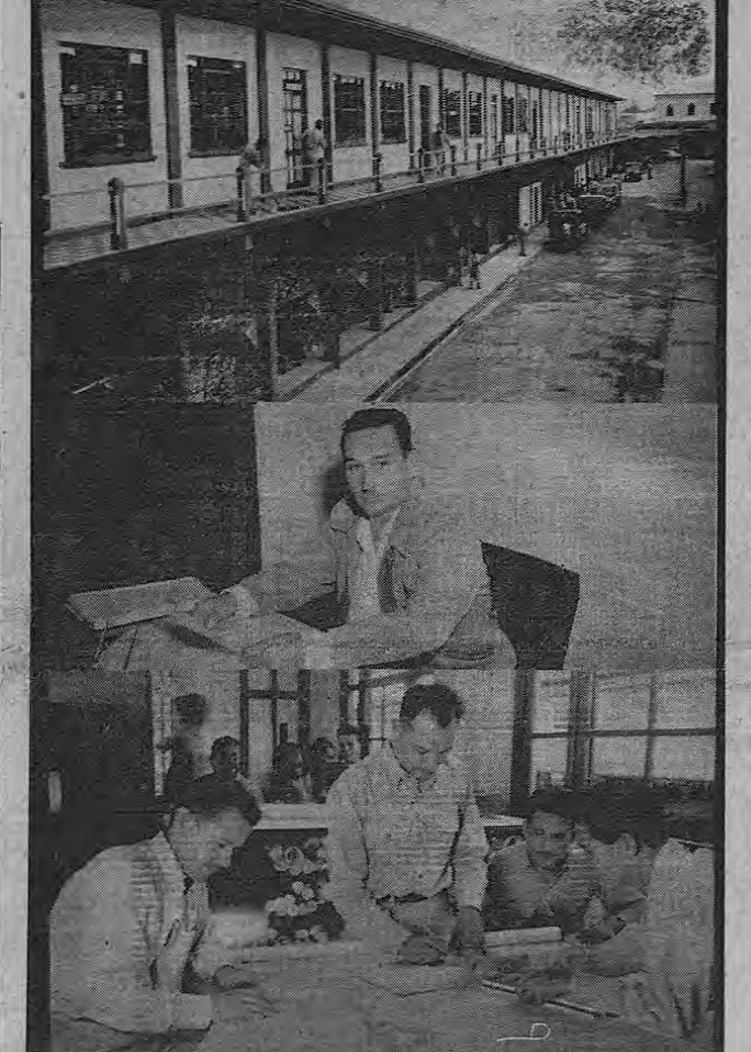
Con una sencilla ceremonia que se celebrará hoy a las ocho y media horas, quedará inaugurado el nuevo edificio del Ministerio de Obras Públicas. En el presente grabado puede apreciarse, en primer plano, el ala inferior del Ministerio que ha sido acondicionado de manera que quedan coordinadas todas las secciones del mismo; fotografía del señor Ministro, don Gonzalo Jiménez en su mesa de trabajo y finalmente, una de las dependencias, la de Ingeniería. (Pasa a la Pág. CATORCE)

Quedan centralizadas todas las dependencias de ese Ministerio, con grandes economías para el Estado y para el país.