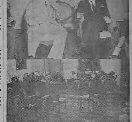
EL LIC. ECHANDI AGASAJA A DON RICARDO TOLEDO Este arreglo fotográfico muestra dos aspectos del agasajo que le ofreció el señor Ministro de Relaciones Exteriores, licenciado don Mario Echandi, a su antecesor, don Ricardo Toledo E., el jueves, en horas de la noche, en la Casa Amarilla. La reunión estuvo muy animada y cordial.