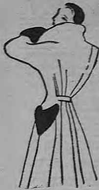
La moda en París vista por Simone Deambrosis-Martins: Abrigo de paño gris con cuello y puños de nutria. (Creación Helma).