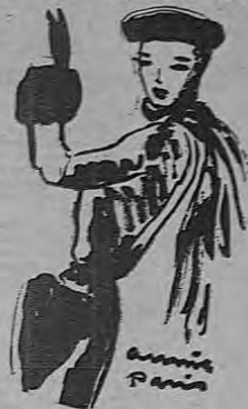
La moda en París vista por Simone Deambrosis-Martins: Toaca y guantes de visón. (Creación Pierre Balmain).